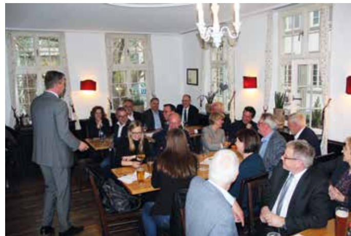
> Die Gästeschar in gemütlicher Runde

alles Dinge, die aus Sicht des BBW dringend geklärt werden müssen. Denn beim BBW ist man überzeugt, dass nach der Einführung des Bürgergelds das Abstandsgebot zur Grundversicherung nicht mehr eingehalten wird. Welche Signalwirkung wird das Tarifergebnis TVöD auf die im Herbst anstehende Einkommensrunde TV-L haben? Hier bezog Rosenber-