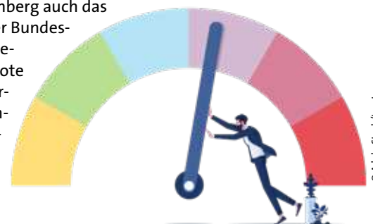
> BBW Magazin | Juli/August 2025

berger die Arbeitszeitreduzierung für diesen Personenkreis für einen zwingend notwendigen Schritt, um den Menschen mit Handicap ein Stück weit entgegenzukommen. Dass wenigstens ältere Beamtinnen und Beamte ab Herbst 2026 weniger arbeiten sollen, wertet der BBW als ersten Erfolg seines unermüdlichen Einsatzes für eine Reduzierung und Flexibilisierung der Arbeitszeit im Beamtenbereich. Der Beamtenbund sei deshalb in den vergangenen Wochen in intensivem Austausch mit allen vier Fraktionen gewesen, insbesondere mit der CDU. Sie habe Unterstützung signalisiert. ■