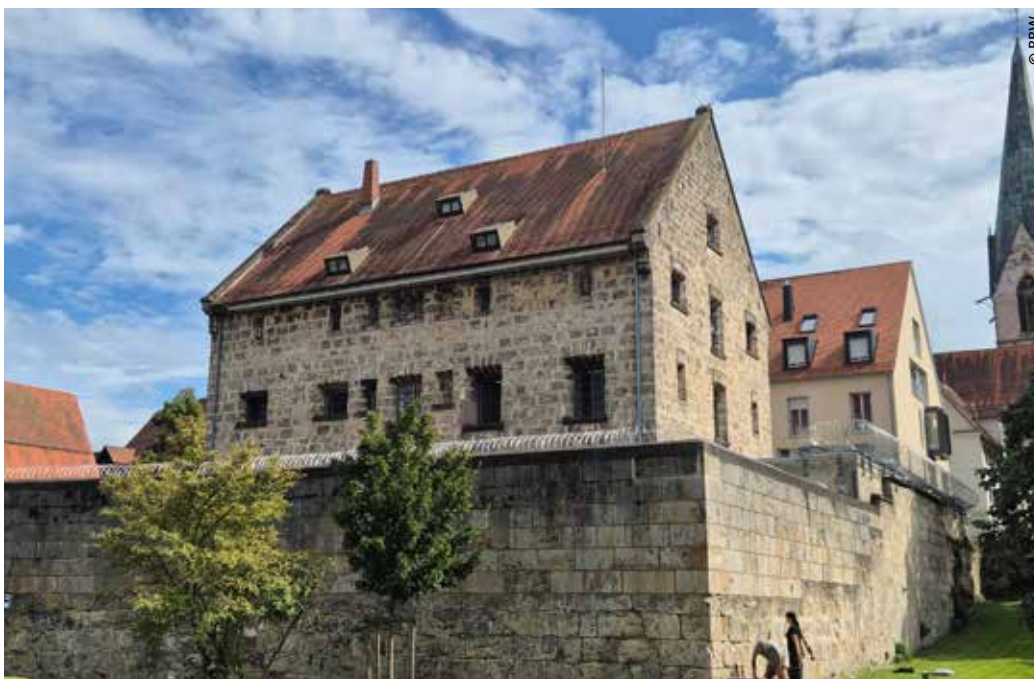
► 20 Haftplätze befinden sich derzeit noch in der 1861 gebauten alten Justizvollzugsanstalt (JVA) Rottweil. Schon Nina Schenk Gräfin von Stauffenberg, Ehefrau von Claus Schenk Graf von Stauffenberg, war hier einst inhaftiert.

Die Personalsituation ist laut dem BSBD leider dennoch enorm angespannt. Dieser