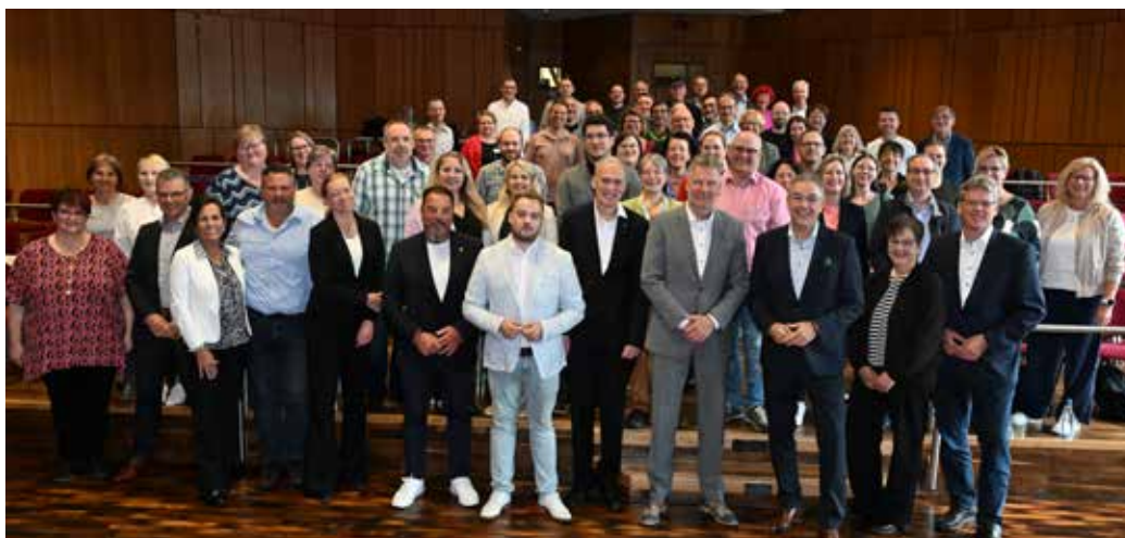
> Mehr als 70 Teilnehmende brachten bei der Regionalkonferenz am 16. September Input nach Stuttgart.

Fragen, Beiträge und Meinungen können bis dahin an tarif@dbb.de gerichtet werden. Im Anschluss wird das Forderungspaket für die Tarifverhandlungen zum TV-L beschlossen, die am 3. Dezember 2025 starten und 2026 fortgesetzt werden.