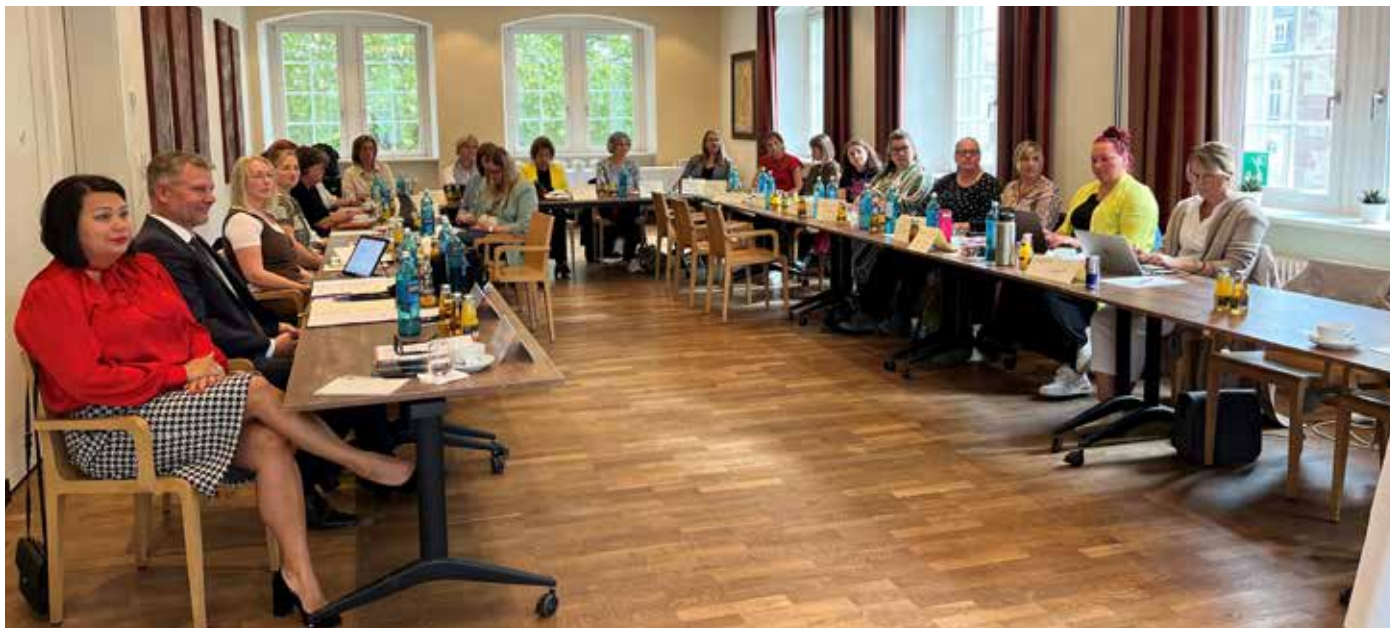
> Richtungweisende Entscheidungen und ein intensiver Austausch erwarteten die Teilnehmenden bei der Landesfrauentagung in Stuttgart.

Berufsbeamtentum. In diesem Kontext erklärte er: „Es ergibt auch finanziell keinen Sinn, wenn Beamtinnen und Beamte in die gesetzliche Krankenversicherung und das gesetzliche Rentensystem einzahlen.“