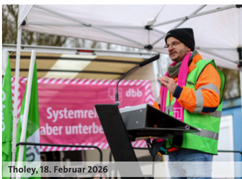
Tholey, 18. Februar 2026