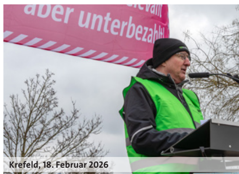
Krefeld, 18. Februar 2026