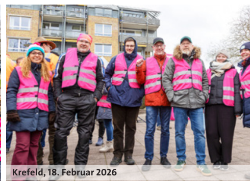
Krefeld, 18. Februar 2026