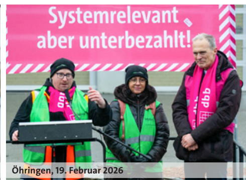
Öhringen, 19. Februar 2026

Nachdem die zweite Verhandlungsrunde mit der Autobahn GmbH zur Einkommensrunde 2026 erfolglos beendet wurde, setzten die Beschäftigten die Arbeitgeberin mit Warnstreiks unter Druck. In Krefeld, Tholey und Öhringen traten sie am 18. und 19. Februar 2026 vor die Autobahnmeistereien und zeigten auf Kundengebungen ihren Unmut.