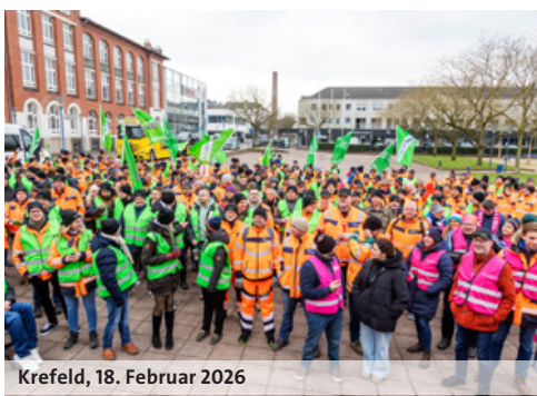
Krefeld, 18. Februar 2026